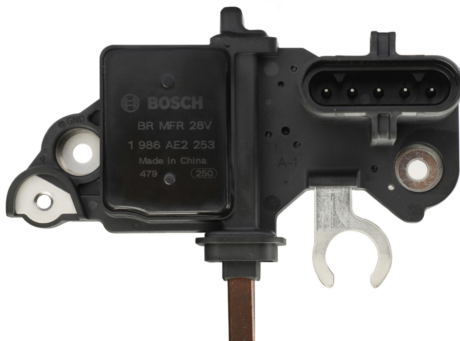
Imagem do regulador

Conheça a nova versão do Regulador de Tensão REG253 desenvolvido especialmente para aplicações HCV . Esta nova versão oferece melhor funcionalidade, características técnicas atualizadas sendo indicado principalmente para aplicações que possuem alternadores ligados em paralelo .